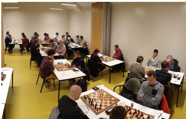
De 1 e ronde van het toernooi in Maastricht op dinsdag 10 maart. De rondes 2 t/m 7 werden online gespeeld.