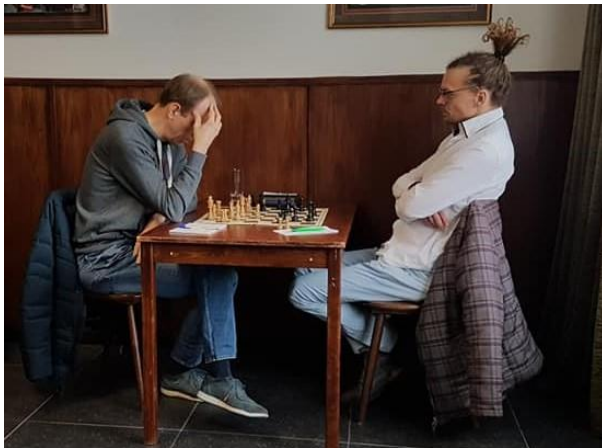
Een van de partijen tijdens de wedstrijd tussen Hoensbroek Max Euwe en Voerendaal 3 op 1 maart.

De LiSB-competitie 2019-2020 werd vanwege 'corona' in de knop gebroken. De teamresultaten worden officieel als ongeldig beschouwd en daarom is er dit seizoen ook geen promotie en degradatie. De individuele partijen tellen wel mee voor de KNSB-rating.