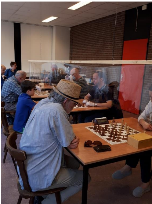
Het bordschaak, juli 2020 bij de vereniging DJC in Stein: met de nodige maatregelen zoals een tussenschot.