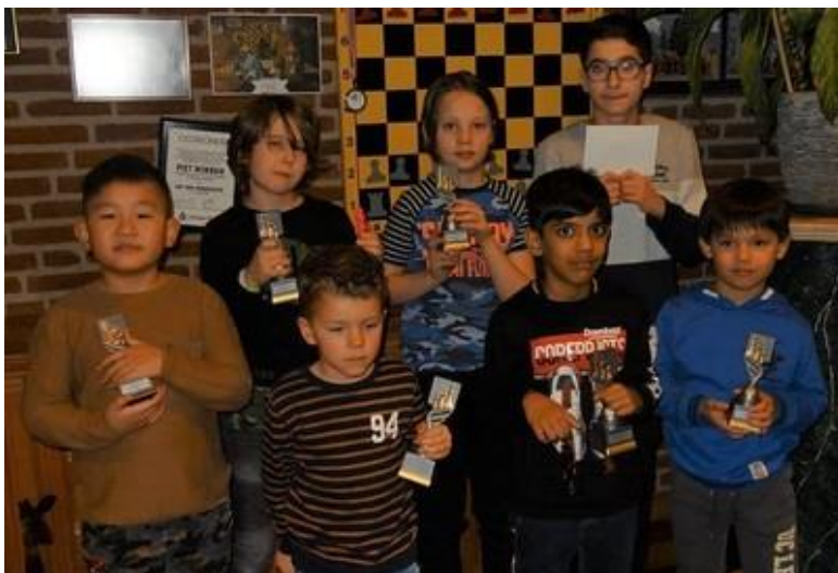
Op deze foto's de trotse prijswinnaars.