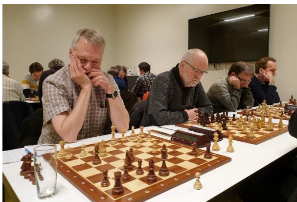
Team Voerendaal 1.

De LiSB Rapidcompetitie voor clubteams 2019-2020 werd afgebroken na de 1 e ronde. Deze 1 e ronde werd gespeeld in februari. De 2 e ronde, gepland 16 - 20 maart, werd vanwege 'corona' niet meer gespeeld. Bijgaande foto's zijn genomen tijdens de rapidavond van groep A1 in Maastricht.