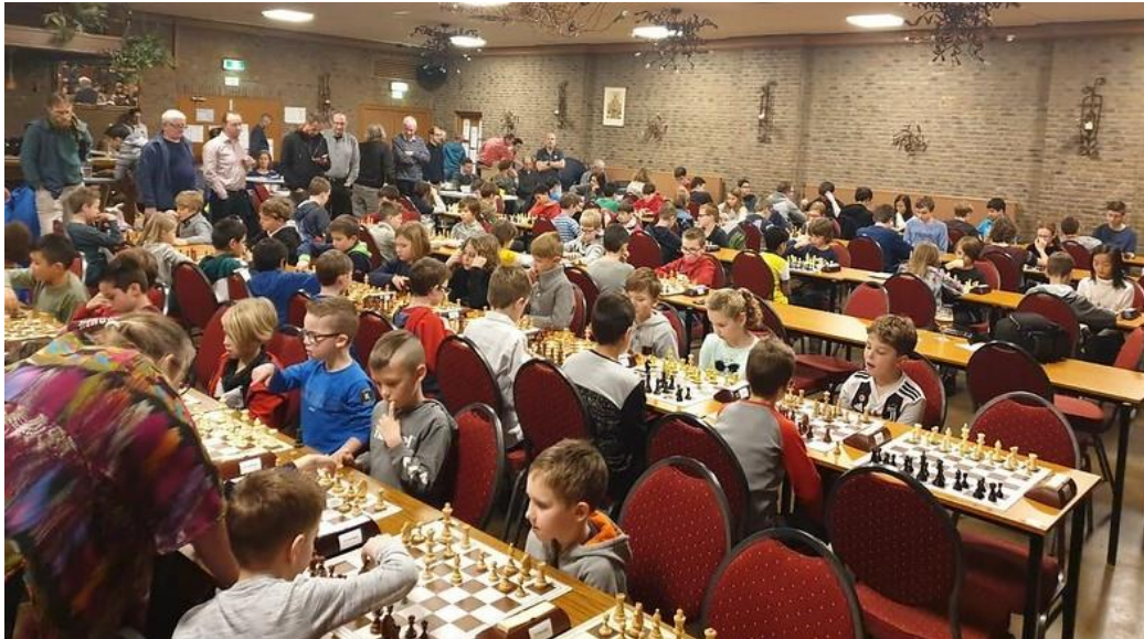
Het 14 e SamSam jeugdtoernooi in Klimmen trok maar liefst 89 deelnemers, een nieuw record voor dit toernooi.

Op zondag 26 januari 2020 vond in Café Keulen in Klimmen het 14 e Sam Sam jeugdtoernooi plaats, meetellend voor de Limburgse Jeugd Grand Prix (JGP). Het werd 'n succes met maar liefst 89 deelnemers, een nieuw deelnemersrecord voor dit toernooi.