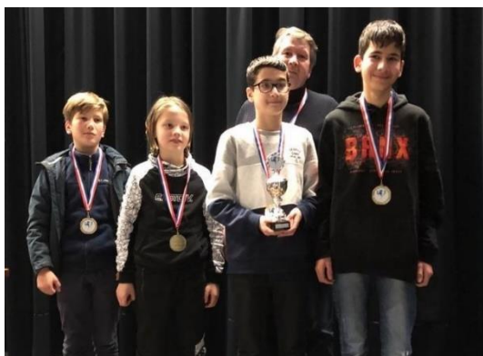
Het team uit Limburg behaalde een mooie 3 e plaats.

uitgevochten door 30 hiervoor gekwalificeerde teams uit heel Nederland. In dit grote en sterke deelnemersveld werd het team uit Limburg na drie dagen en negen wedstrijden schaken zeer verdienstelijk 3 e met 12 matchpunten en 21 bordpunten. Alleen een team uit Eindhoven (1 e ) en Leiden (2 e ) moesten zij voor laten gaan.