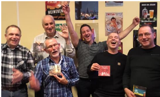
De dolgelukkige prijswinnaars. Er waren zes prijzen te winnen.