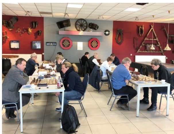
Op zaterdag 7 maart werd de 6 e ronde van de KNSB-competitie gespeeld. Deze foto is genomen in buurtcentrum De Romein in Maastricht, waar de stadsderby werd gespeeld tussen de teams van Zwart Wit en Maastricht.

Ook de KNSB-competitie 2019-2020 werd afgebroken. De 6 e ronde op zaterdag 7 maart bleek de laatste te zijn geweest. De resterende drie ronden werden niet meer gespeeld. De KNSB besloot om geen promotie/degradatie toe te passen. Er waren echter wel enkele uitzonderingen. Eén daarvan: om het gat in de eerste klasse op te vullen promoveert de beste nummer 1 (Blerick 1) na zes ronden uit de tweede klasse naar de eerste klasse. Dus in ieder geval toch een mooi resultaat voor een Limburgse vereniging. Het is wel raar op deze manier in zo'n bizarre tijd, maar toch: gefeliciteerd! Blerick is de laatste jaren in de KNSB-competitie als een komeet omhoog geschoten.