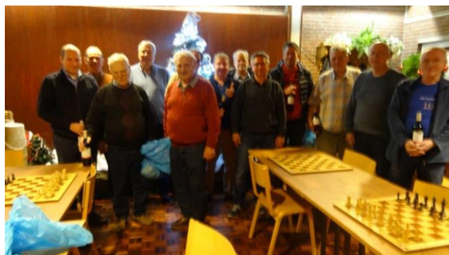
Een aantal prijswinnaars.

De Tegelse Schaak Vereniging organiseerde op vrijdag 27 december 2019 ("3e kerstdag") het 9 e A74-schaaktoernooi. Dit is een toernooi voor 40-plussers waarbij het niet alleen om het spel, maar vooral ook om de gezelligheid gaat. Er waren 43 deelnemers, een paar minder dan een jaar eerder maar niettemin een heel mooi aantal. Ze gingen allemaal met een flinke zak vlees huiswaarts. De winnaars kregen bovendien een fles wijn. Ook de goulashsoep en belegde broodjes waren weer van uitstekende kwaliteit. De spelers werden naar speelsterkte ingedeeld in groepen van vier; zij speelden 3 ronden