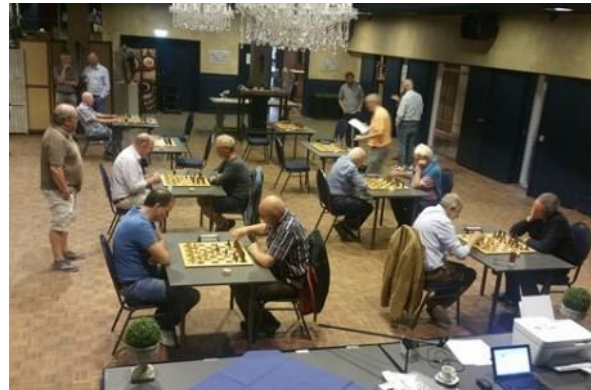
Beeld van de eerste avond van het zomertoernooi in Venlo.