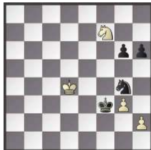
Diagram na 45...Pg4