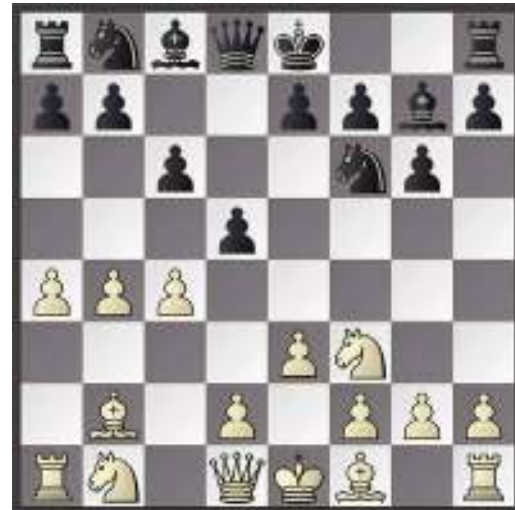
Diagram na 6.a4