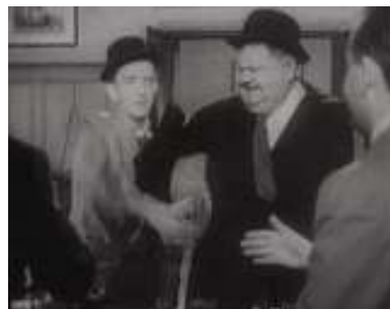
Stan & Ollie

Dit wordt dan handen en voeten gegeven door een humoristische boodschap. Een grap, een geintje, een gebbetje of een lollig verhaaltje. Er wordt daarna soms gelachen. Omdat humor een zeer subjectief fenomeen is, wordt er vaak zeer verschillend op gereageerd. " Flauw zeg! ", " Keileuk! ", " Gossie wat melig! ", " Ik kwam niet meer bij mezelf van het lachen! ", " Ha, ha ,ha! ", zijn zo wat varia.