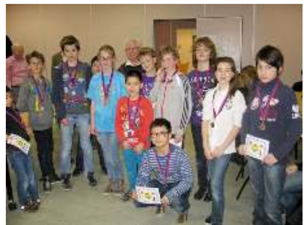
Alle prijswinnaars van het 24 e Theo van Spijktornooi.