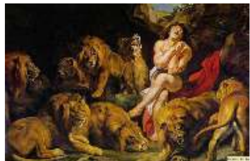
Daniël in de leeuwenkuil. Gezellig hè! Tja, hic sunt leones...

Na deze geforceerde afwikkeling heeft zwart de beste papieren. Het beste om het initiatief vast te houden, was het natuurlijke 20...Tc8 . Maar dat had u waarschijnlijk direct al gezien. Peter, wellicht aangestoken door Max' ondernemende spel wil hier ook een combinatoire duit in het schaakzakje doen en komt met: 20...Txe1+? Ziet er effe grappig uit. De zet ontpopt zich echter, om met onze Oosterburen te spreken, als ein Schuss in den Ofen ... 2 21.Dxe1 Pc2 22.Da5! Pxa3 23.bxa3 Pe4 24.Dxa6 f5 25.Dxa4 Pxd6 26.Dxd7 Pf7 27.Dxe6 g6 28.a4 rien ne va plus... 1-0