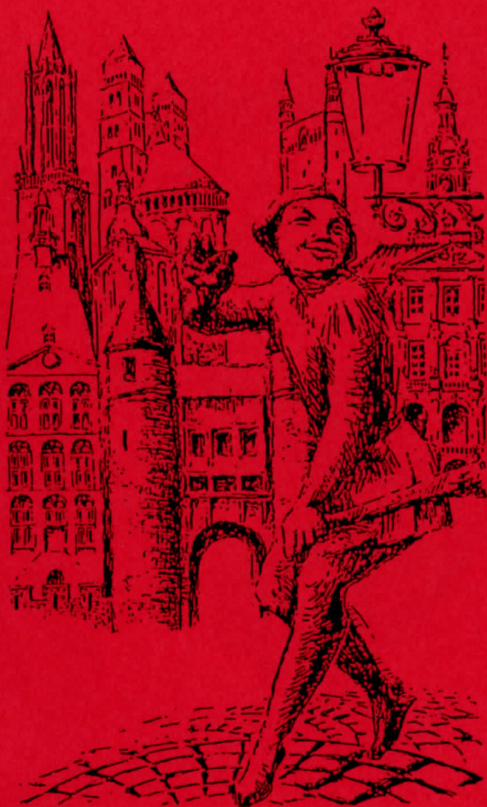
D'n ierste kiebitzer