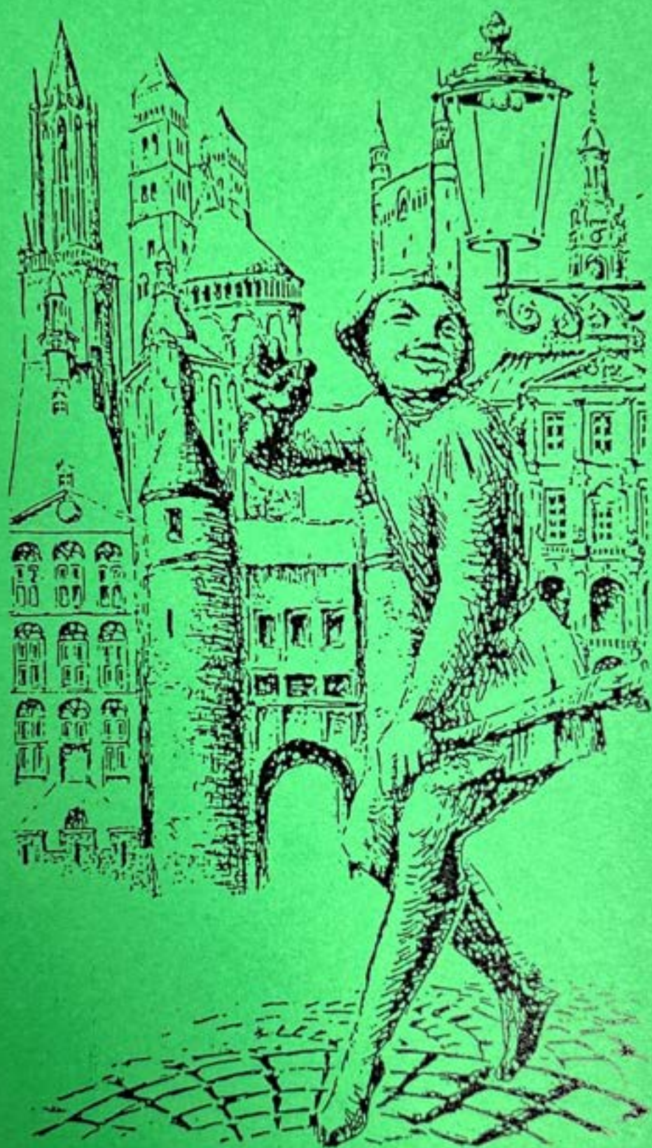
D'n ierste kiebitzer