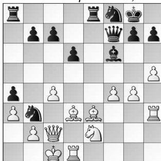
DIAGRAM 3 ----->

Deze zet jaagt de witte koning alleen maar naar een veiliger veld. Met de breekzet 22... b5 kan zwart nog proberen een tegenaanval te lanceren.