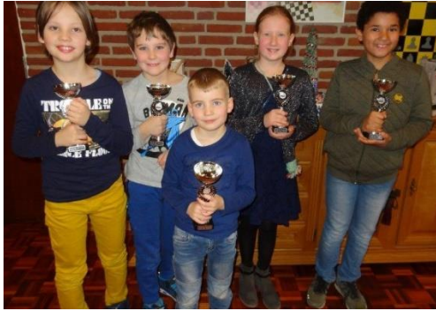
De kampioenen tonen de gewonnen bekers.