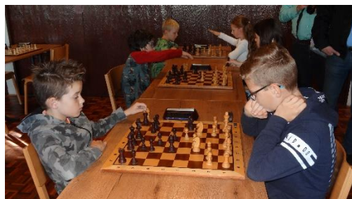
Beeld van het jeugdtoernooi in Tegelen.