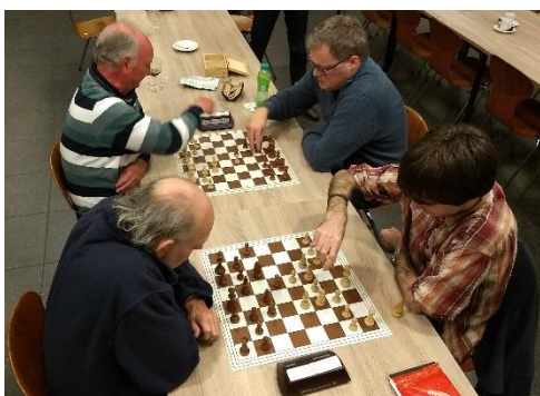
Doorgeefschaak zorgt altijd voor verrassende momenten.