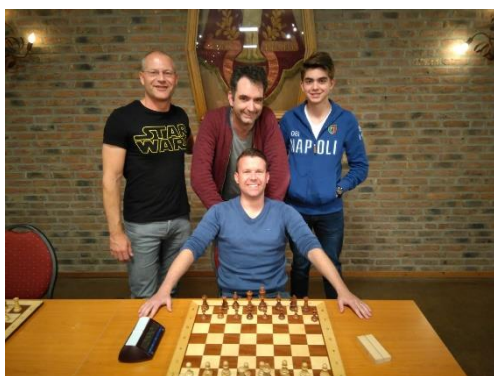
Het team van Blerick.