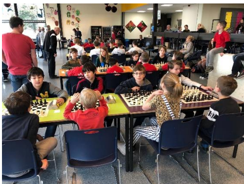
Limburgs kampioenschap schoolschaak. Overzicht van de speelzaal.