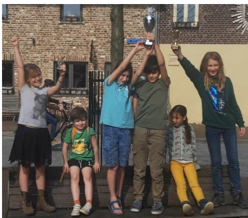
Trotse prijswinnaars in Eijsden.