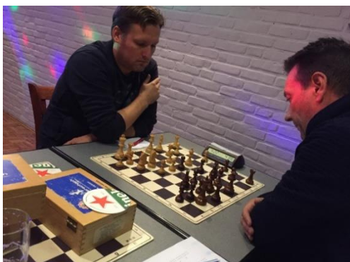
De SchaakRockNacht. Schaken terwijl de muziek keihard klinkt.