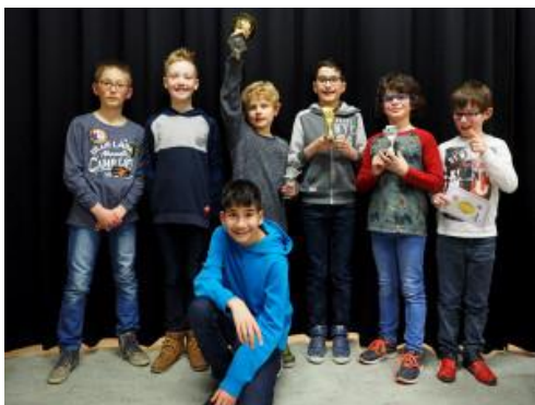
SV Tegelen werd winnaar van de verenigingsprijs van het jeugdtoernooi in Venlo.