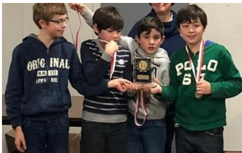
Het team van basisschool Scharn.